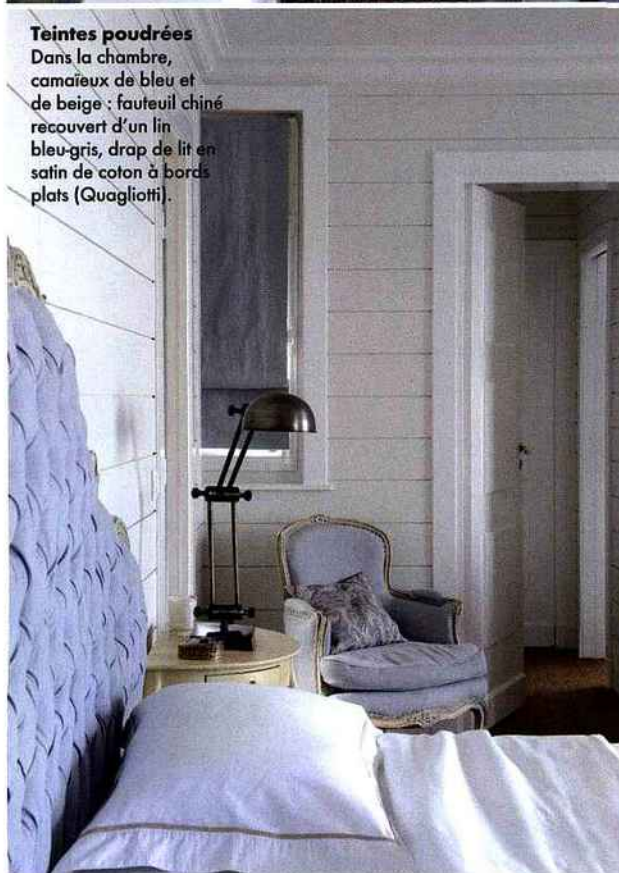
Teintes poudrées Dans la chambre, camaïeux de bleu et de beige : fauteuil chiné recouvert d'un lin bleu-gris, drap de lit en satin de coton à bords plats (Quagliotti).