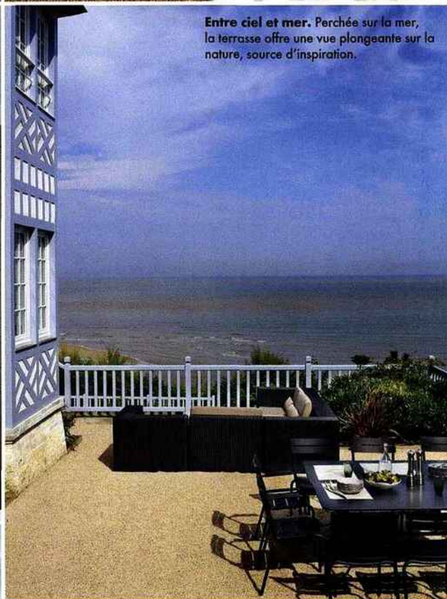
Entre ciel et mer. Perchée sur la mer, la terrasse offre une vue plongeante sur la nature, source d'inspiration.