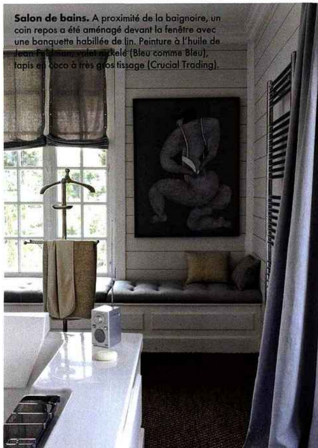
Salon de bains. A proximité de la baignoire, un coin repos a été aménagé devant la fenêtre avec une banquette habillée de lin. Peinture à l'huile de Jean Paul Goude, volet en Kéle (Bleu comme Bleu), tapis en coco à très gros tissage (Crucial Trading).